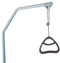
Potence de lit