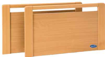
Panneau Susanne hêtre avec rail, pour barrières bois ou époxy.

Chaque partie du lit SB 755 est démontable et pèse moins de 25 Kg.