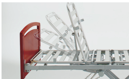
Relèvement-buste à translation afin d'atténuer les effets de friction.