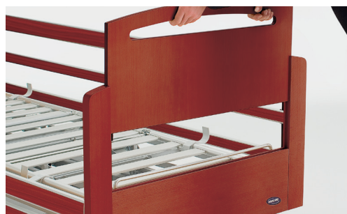
Panneau Victoria avec intérieur amovible pour faciliter les soins au niveau des pieds.